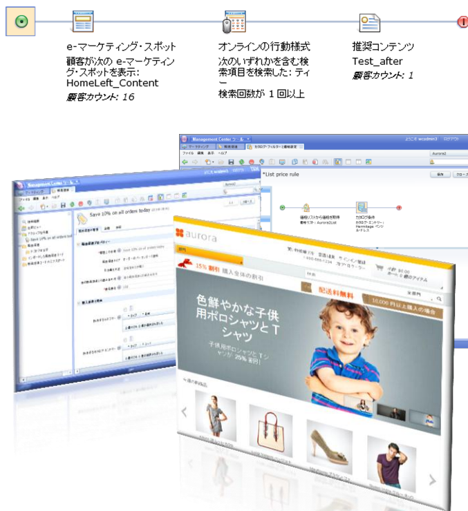
マーケティング/プロモーション施策例